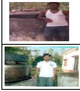
एस अधिकारी त बहराइच